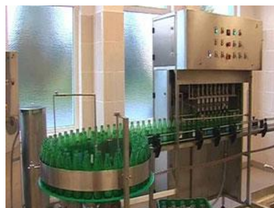
SCH-APK/... automata palackozó gép